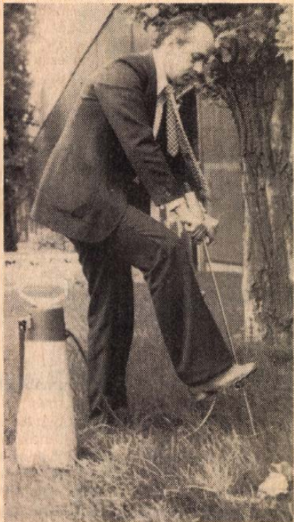
A tápanyagok talajba juttatására alkalmas, permetezőgépre csatlakoztatható talajfecskendő a Patent műszaki koordinációs iroda mutatta be.

kongresszusokon való részvételének, továbbá külföldi találmányi jogok megvásárlásának, tudományos-kutatói műszerek, alkatrészek és anyagok beszerzésének, illetve külföldi szakemberek, tudósok és diákok magyarországi tanulmányútjainak támogatását. A szerződő felek a Magyar Tudományos Akadémianál működő MTA—Soros Alapítvány Bizottságot alakítanak. (MTI)